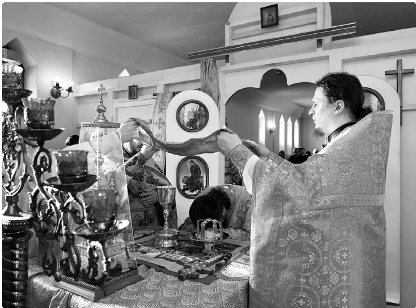
В алтаре храма во имя святителя Димитрия, митрополита Ростовского. Божественная литургия. Бийский архиерейский дом. 21 февраля 2021 г.