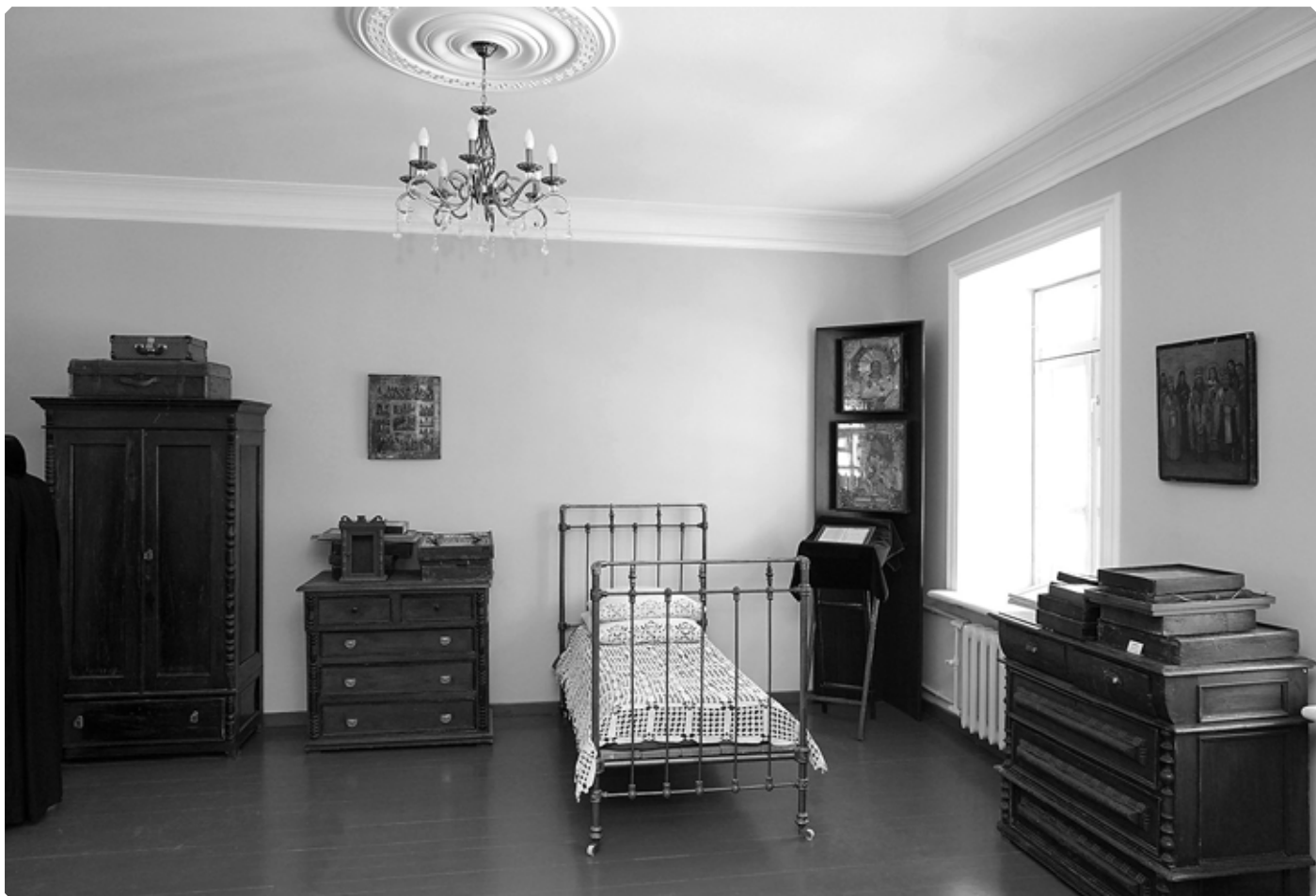
Музейная экспозиция «Архиерейская опочивальня». Фрагмент. Музей истории Алтайской духовной миссии. 21 февраля 2021 года