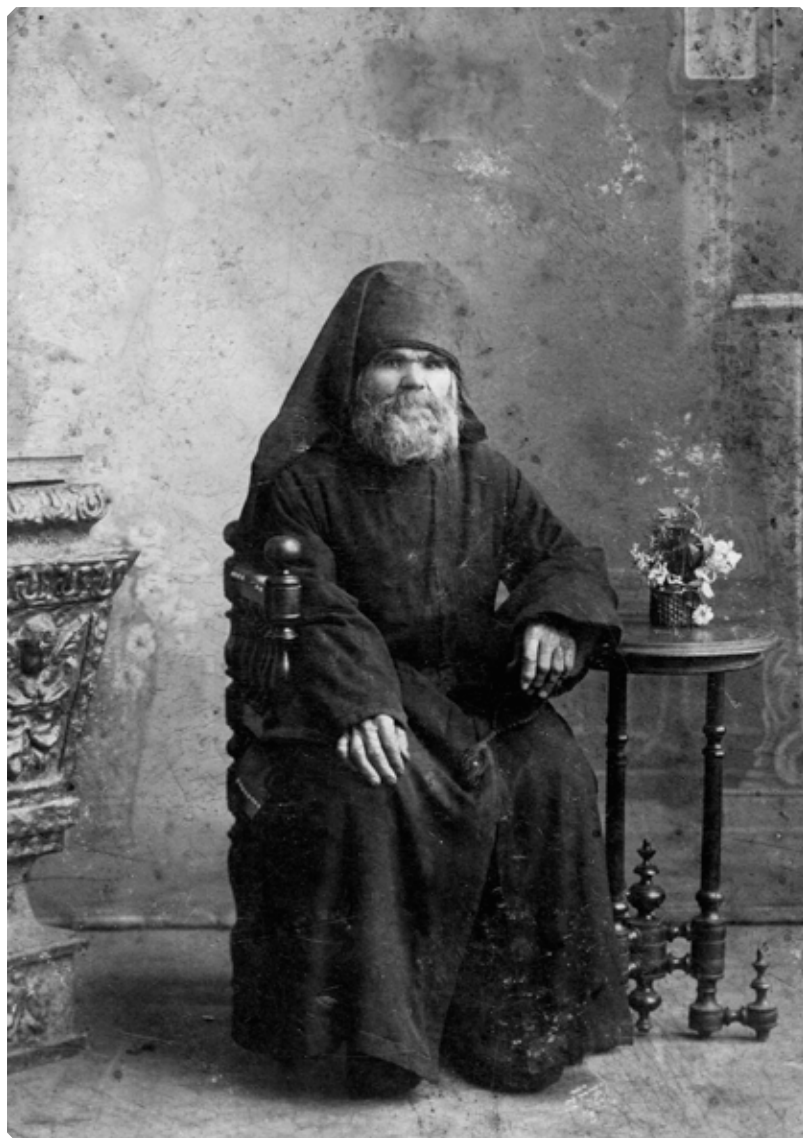
Монах. Фотография В.Л. Шаниора. г. Бийск. Начало XX в. МАДМ

в 1886–1888 гг., диакон Казанской архиерейской церкви с 1888 г., на 1890 г.