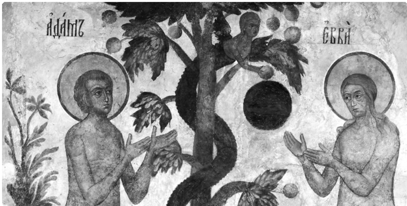
Фреска «Грехопадение Адама и Евы». Фрагмент. Троицкий Макарьев Калязинский монастырь. XVII в.

Вниманию новоначальных христиан мы предлагаем продолжение публикации статьи профессора Московской духовной академии и семинарии Алексея Ильича Осипова «Почему Православие есть истинная вера?» У заслуженного профессора и старейшего преподавателя МДАиС есть уникальный талант: просто и доходчиво рассказывать об очень сложных и важных вещах.