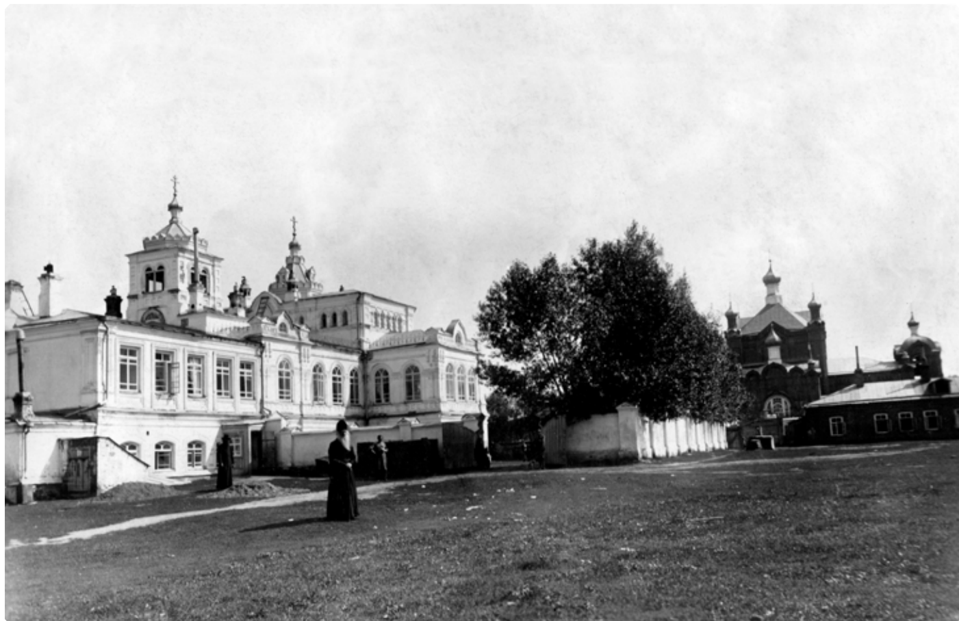
Бийское архиерейское подворье. Вид со стороны Миссионерского катехизаторского училища. Начало XX в. БКМ