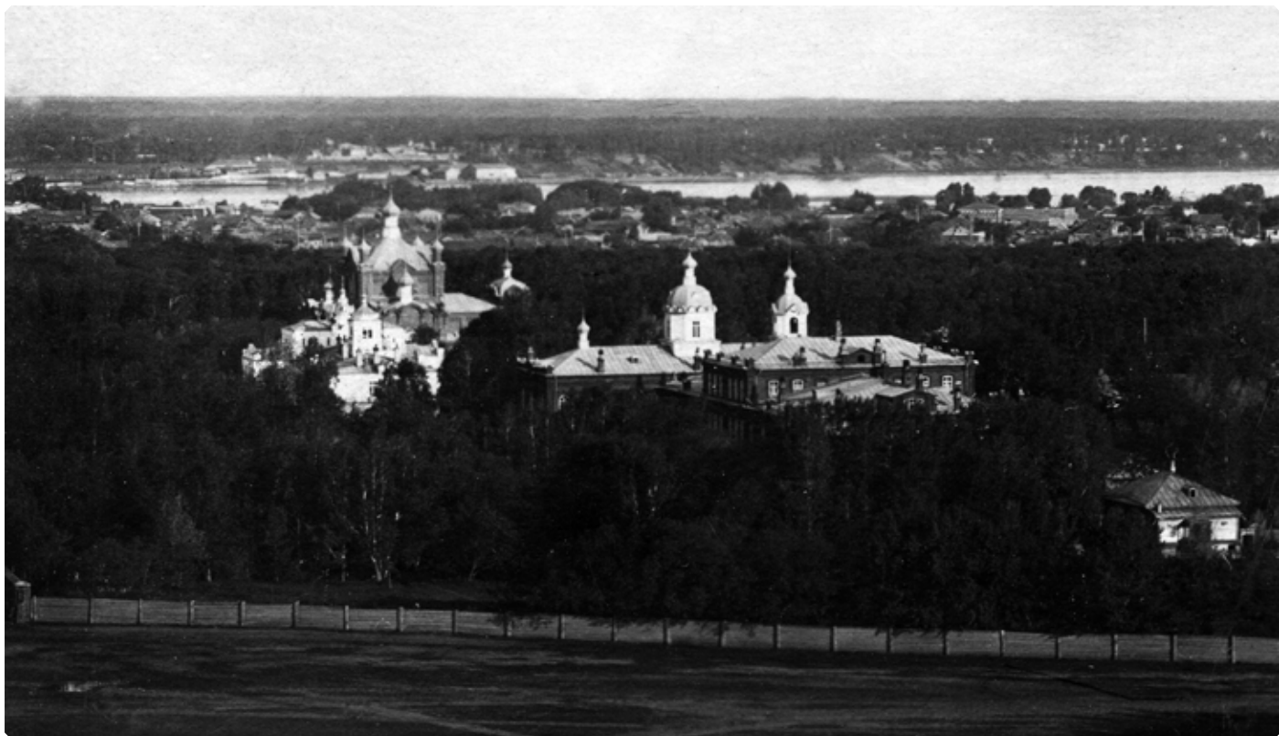
Бийское архиерейское подворье и Бийский архиерейский дом (слева на переднем плане). Фрагмент. 1910-е гг.