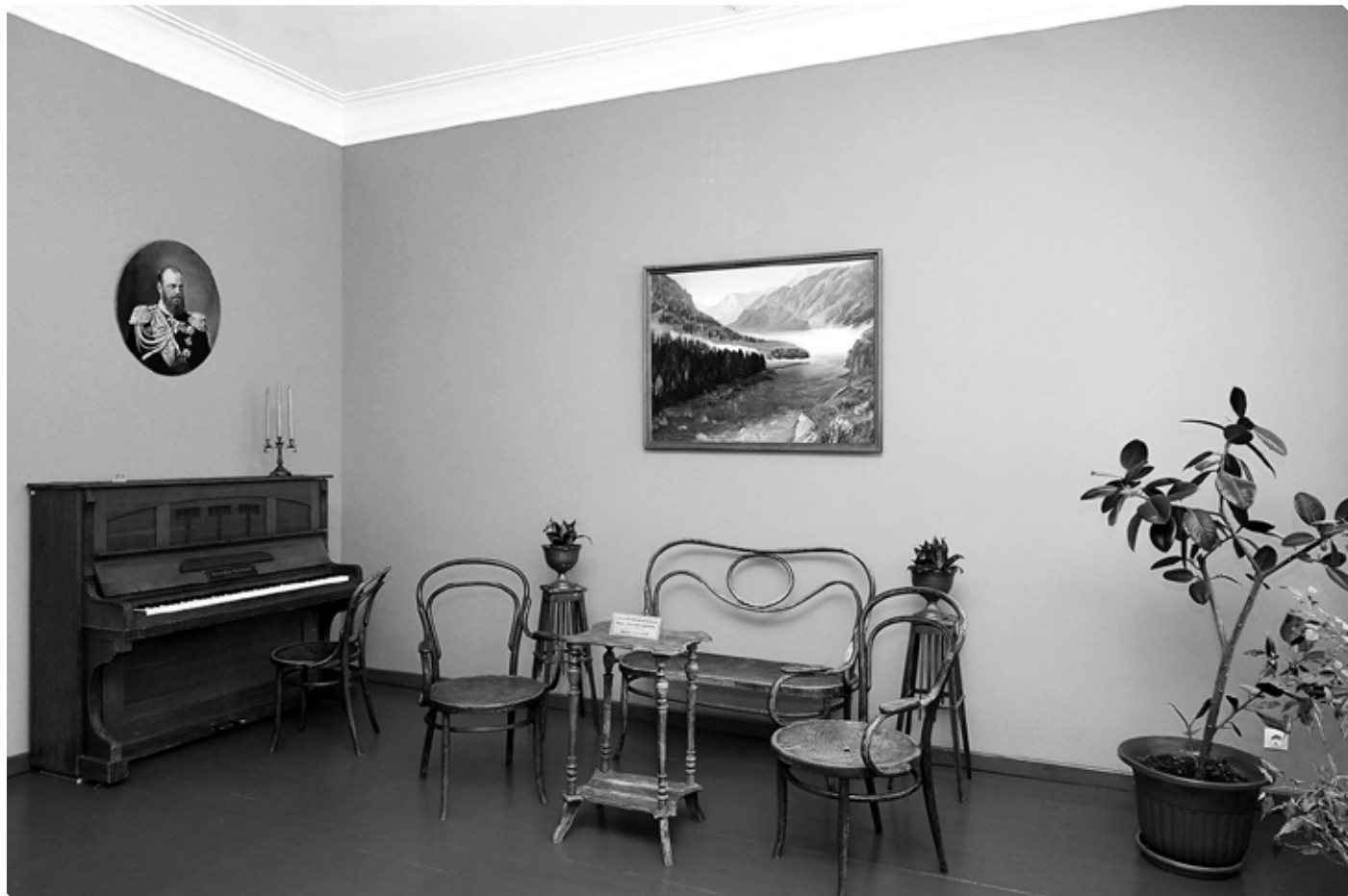
Старинная мебель в интерьере экспозиции «Красная гостиная». Музей истории Алтайской духовной миссии. 21 февраля 2021 года

Большие изменения произошли и на втором этаже. Он стал мемориальным. Примерно таким, каким был при епископе Бийском Макарии (Невском), о котором рассказывает экспозиция в коридоре. Из окон, выходящих на север, хорошо виден памятник, установленный осенью 2009 года на Архиерейской площади этому выдающемуся