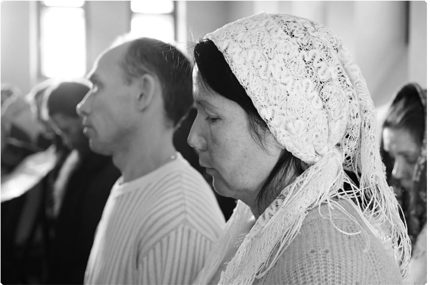
Прихожане храма во имя святителя Димитрия, митрополита Ростовского. Бийский архиерейский дом. 21 февраля 2021 г.