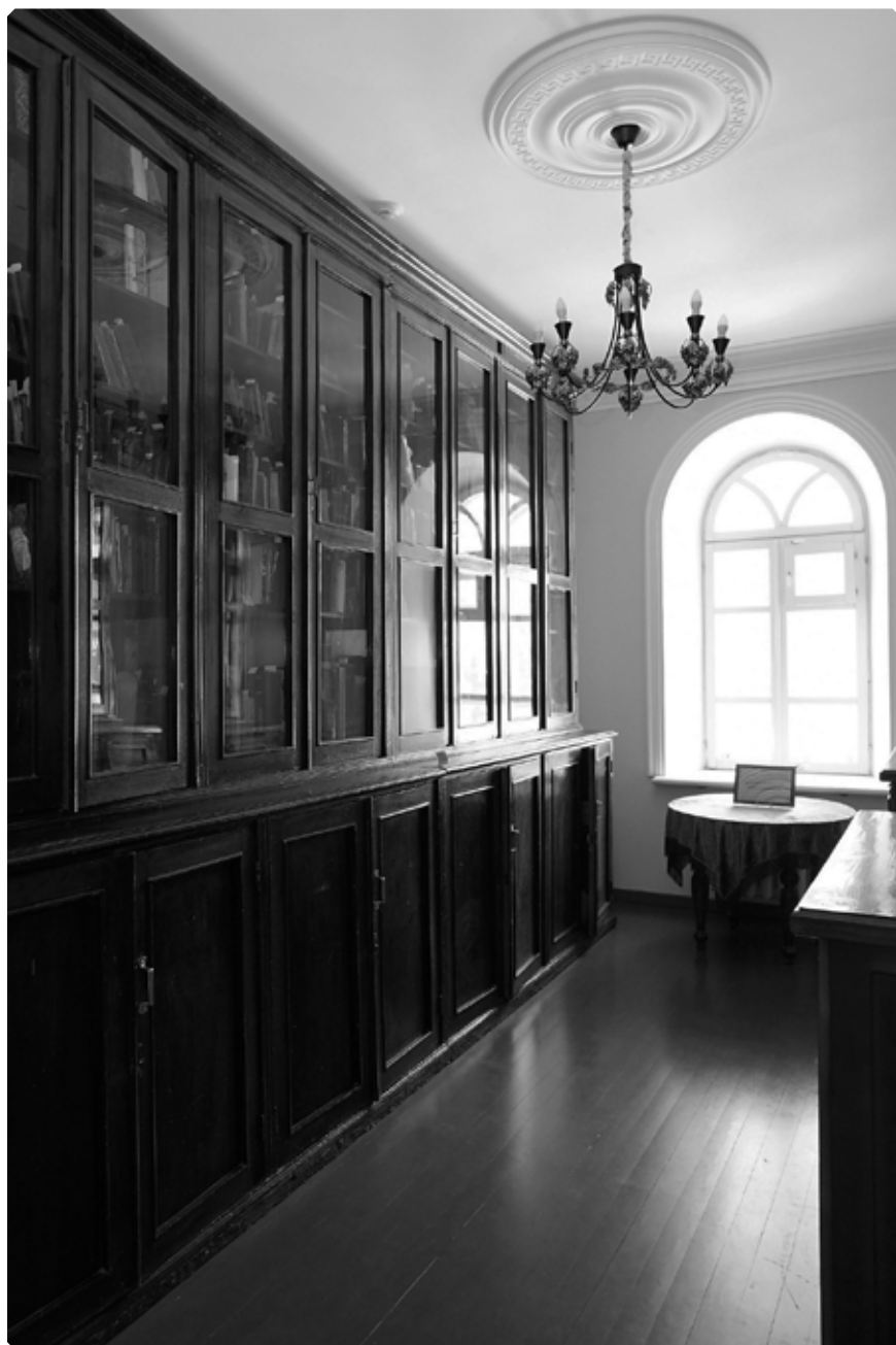
Музейная экспозиция «Архиерейская библиотека». Музей истории Алтайской духовной миссии. 21 февраля 2021 года

28 января 2021 года Музеем истории Алтайской духовной миссии исполнилось 13 лет. Он был открыт в 2008 году по благословению епископа Барнаульского и Алтайского Максима (Дмитриева) при Свято-Димитриевской церкви города Бийска по инициативе Бийского благочиния и Бийского отделения Демидовского фонда. Первая экспозиция музея размещалась в помещении воскресной школы храма.