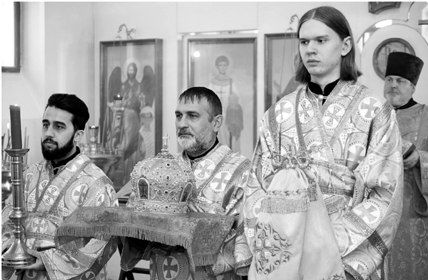
Церковнослужители Успенского кафедрального собора города Бийска. Божественная литургия. Бийский архиерейский дом. 21 февраля 2021 г.