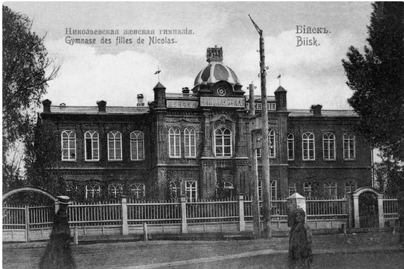
Николаевская женская гимназия. Успенская улица. г. Бийск. Почтовая карточка. 1910-е гг. МАДМ