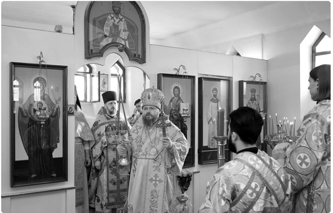
Епископ Бийский и Белокурихинский Серафим совершает Божественную литургию. Бийский архиерейский дом. 21 февраля 2021 г.