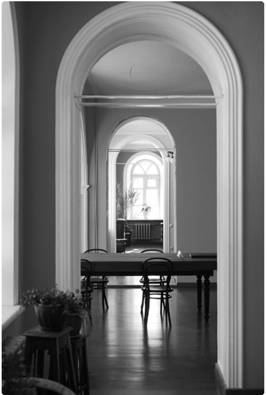
Восстановленная парадная анфилада архиерейского этажа. Музей истории Алтайской духовной миссии. 21 февраля 2021 года

За последние несколько лет коллективом музея совместно с благотворителями и специалистами, проводящими реконструкцию, проделана огромная работа, которая вскоре будет завершена. Но не завершится работа, к которой каждый православный человек призван в соработники